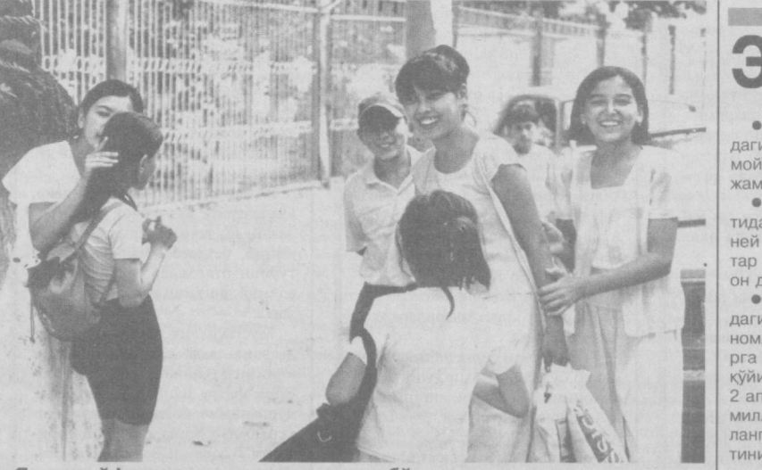
Яхши кайфият ҳамиша ҳамроҳингиз бўлсин.

беринг. Кичик-кичик шеш, топшомок, мақолалар-ни ёд олдира бораганиз яна яхши. Еши еттига етиб қолган бола катталарнинг сўзини бўлмадан, уларнинг гапига аралашмай, ўзига гапирилаётганда диққат билан тинглайди-ган бўла бориши лозим. Унинг кўнглини орасида яшаётганлиги, атрофдагиларга ҳалақат бермай, ақсинча ёрдамлашиб, одоб-ахлоқни билиш керак-лиги ҳақида тез-тез эслаб туринг. Болага ўш-ликдан раҳмдиллик, ўзидан кичикларга ёрдам берадиган, ранжитилган ўртоқларининг ённи олидиган, ўйинчоқларини бошқалар билан баҳам кўрадиган хислатларини сингдира бориш орқали унда атрофдагиларга нисбатан эътибор билан қараш ва ҳақуийлик каби фазилатларни ривож-лантира бораган бўласиз. Шу билан бирга болани бўлар-бўлмагса мактаб, кўкка кўтариб юборманг. Хулоса қилиб айтганда, бола турли-туман во-қеалар воситасида ўсиб-ўлғайди, онги тараққий-этади. Бола мактабга бормасдан анча илгари уни мактабга тайёрлай бориш ҳар бир ота-онанинг шарафли бурчидадир. Шундангина фарзанднинг мактабга яхши ўқишини таъмин эта олган бўла-миз. Ситорохон РАҲМОНБЕКОВА