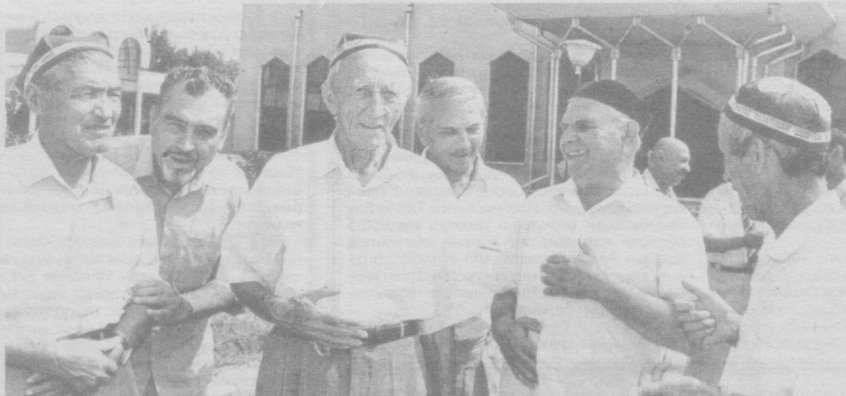
Ҳамза тумани оқсоқоллари.