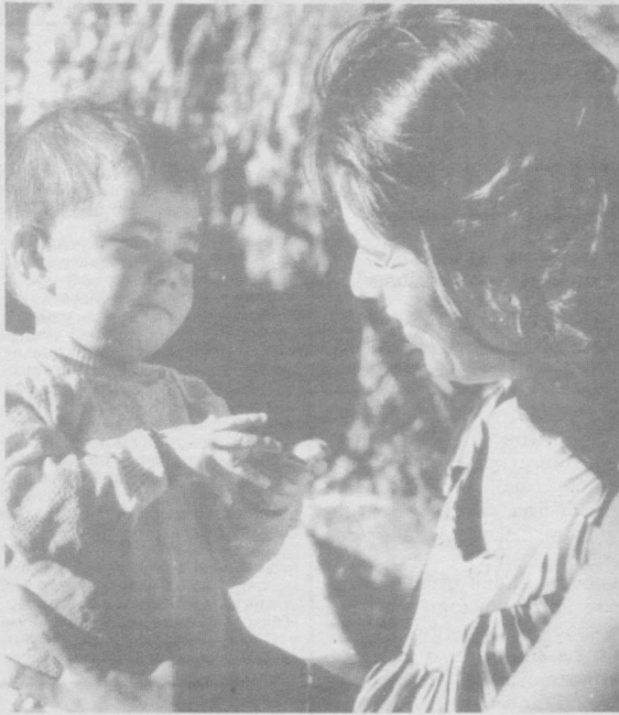
Бахитимга омон бўл, эрқатойим.