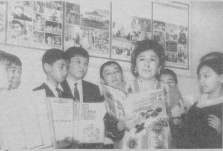
Ёш қаламкашлар тўғарағида машғулот.

Инсоният маънавий дунёсининг сар-чашмаларидан бўлмиш «Авесто» истиқ-лол туфайли ўз юртига, буюк давлат кураётган ватандошларига беназир хизмат қилаверади. «Авесто» илохий китоблардан бири сифатида хали-ҳануз тадқиқотчиларнинг диққат-марказида турибди. Биз Шарқнинг буюк мутафақ-кири Абулқосим Фирдавсий (940-1030) ижодида «Авесто»нинг тутган ўрнига ўқувчиларимиз диққатини тортмоқчи-миз.