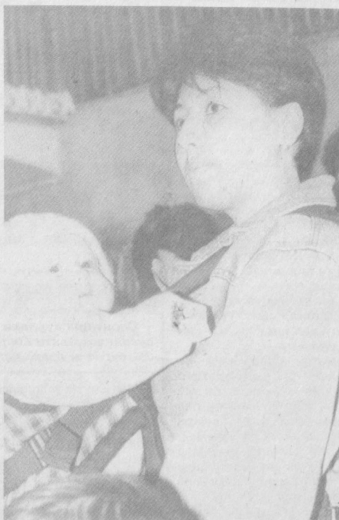
Она ва бола, гул билан лола.

ларга микроб сут солинадиган идиш, сут идиши ювилмадиган сув, сутга қўшилидиган бошқа маҳсулотлардан, яъни ташқи муҳитдан ўтиши мумкин. Лекин сут маҳсулотларидан таш-қари ўсимлик, мева-сабзавот ва гўшт маҳсулотлари ушбу ин-фекцияни юктирувчи ҳақиқий манбалардир. Мутахассисларнинг фикри-дан иерсин микробнинг тарк-алишида рўзгорда ишлатила-диган музлатиш асосий воси-