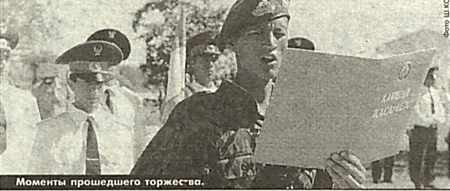
Моменты прошедшего торжества.

В Ургенче состоялось торжественное принятие присяги молодым поколением сотрудников органов внутренних дел.