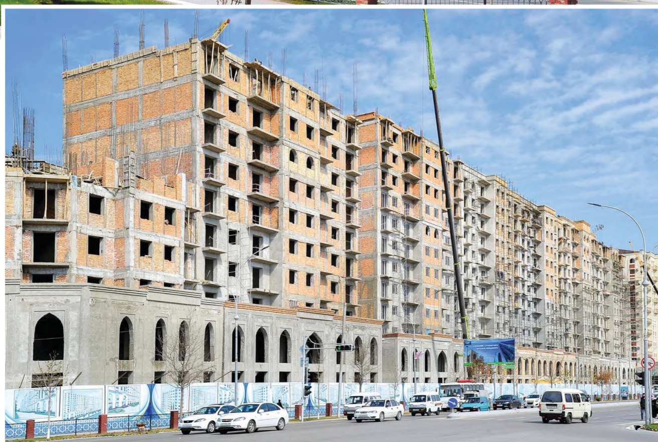
Суратларда: Фарғона шаҳридаги Алишер Навоий кўчасида 11 та 12 қаватдан иборат шинам уй-жойлар барпо этилмоқда.

Бу кўп қаватли уйлар "Файз бинокор қурилиш монтаж" корхонаси, "426-хўжалиқлараро ихтисослаштирилган кўчма колонна" ва "Фарғона қурилиш кўрки" масъулияти чекланган жамияти қурувчилари томонидан бунёд этилмоқда. Турар жой биносининг 1-2 қаватларида Хунармандлар маркази, савдо ва машиқий хизмат кўрсатиш комплекси ва соғломлаштириш мажмуаси фаолияти йўлга қўйилиши режалаштирилган.