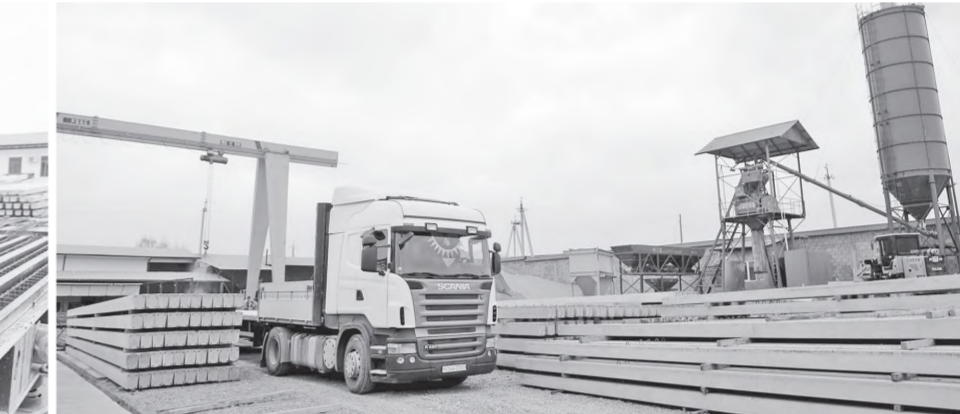
Суратларда: Чортоқ туманидаги "Чортоқ темир бетон" масъулияти чекланган жамиятида.