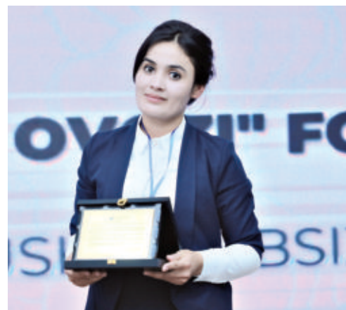
касб-хунарга қайта ўқитмоқда.

Олий Мажлис ҳузуридаги ННТ ва фуқаролик жамиятининг бошқа институтларини қўлаб-қувватлаш жамоат фондининг "Навоий виллоят олис қишлоқ ёшлари орасида тадбиркорликни ривожлантириш ва молиявий савдоҳонлигини ошириш" мавзусидаги давлат грантини кўлга киритиб, ёшларнинг молиявий савдоҳонлигини ошириш мақсадида чекка ҳудудлардаги тенгдошларга ўзи эгаллаган замонавий билимларни улашиб келмоқда. Ҳозирги кунда "Ёшлар дафтари" ва "Аёллар дафтари" бўйича рўйхатга кирган хотин-қизларни