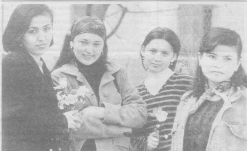
Қалбда ҳамиша баҳор...

Аср вабоси, эллар, миллатлар заволи — терроризм, ёвуз қора кучга қарши кураш бошланди, бу адолатли жангда Ўзбекистон марду майдондир. Йигирма уч йилдан буён уруш