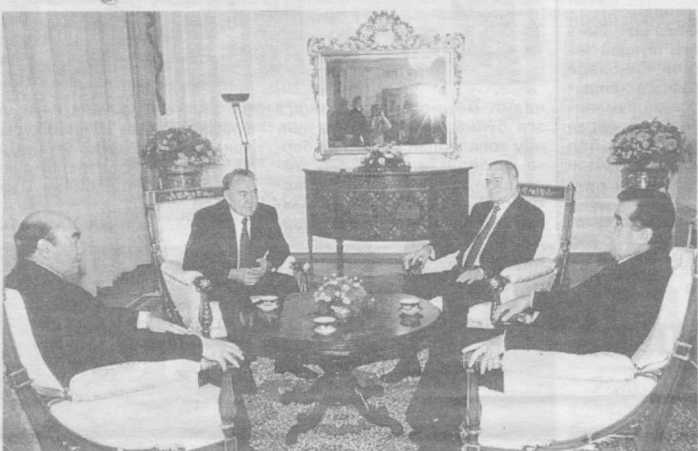
Ўзбекистон Республикаси Президенти Ислам Каримовнинг таклифига биноан 27 декабрь куни мамлакатимизга Қозоғистон Президенти Нурсултон Назарбоев, Қирғизистон Президенти Аскар Акаев ва Тожикистон Президенти Имомали Раҳмонов ташриф буюрди

Сўнгги вақтларда Марказий Осиё дунё ҳамжамиятининг диққат марказига айлиб қолгани сир эмас. Қўшни Афғонистондаги воқеалар дунё давлатлари диққат-эътиборини минтақамизга тортди. Террор, нарқобизнес, экстремизмнинг уясига айлиб қолган Афғонистон бугун бу иллатлардан ҳоли мамлакатда айланмоқда. Бу жараёнда Ўзбекистон раҳбари юртдан оқилона сивасатининг муҳимлиги Марказий Осиёга эмас, дунё хавфсизлиги нўқтай назардан ҳам халқроқ майдонда юқори баҳоланмоқда. Тошкент ҳаммаша тинчлик, дўстлик ва ҳамкорликни мустаҳкамлашга хизмат қиладиган долларб урчушулар мезбони бўлиб келган. Айни пайтда Ўзбекистон Марказий Осиёда тинчлик ва тараққиёт йўлидаги саъй-ҳаракатларни белгилашда узига хос марказга айланиб қолди. Илгари ҳам тўрт мамлакат президенти Тошкентда учрашиб, минтақада юзага келган долларб муаммолар юзасидан фикрлашган, йиғилиб қолган иқтисодий, ижтимоий,