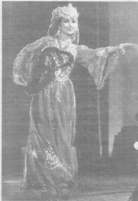
Раққоса хиром айлар...