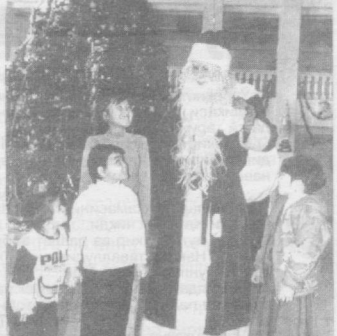
Илгари хабар берганимиздек, хай-рли аънаанага мувофиқ