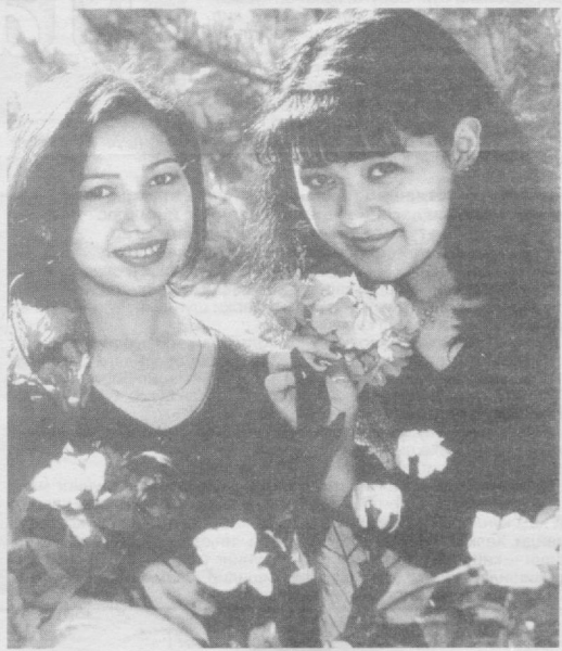
Яхши кайфият доимо ёр бўлсин.