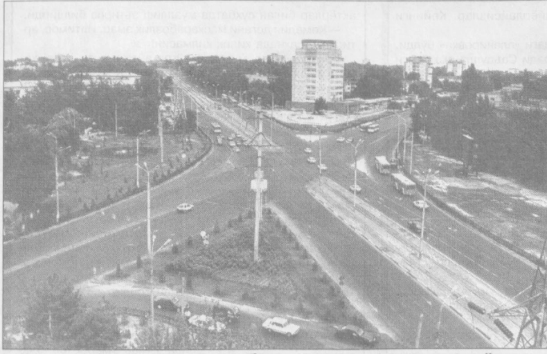
Кенг, равон кўчалар, кўркам бинолар шаҳар хуснига хусн қўшади.