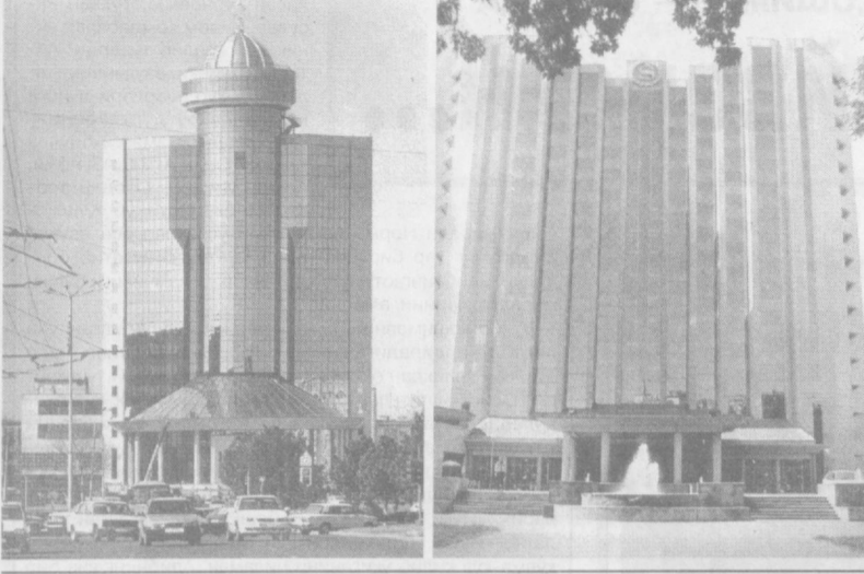
Кенг, равон кўчалар, кўркам бинолар шаҳар хуснига хусн қўшади.