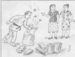
— Бизнинг хўжайин каратэчи, ўтинларни болтасиз ҳам ёриб ташлайверадилар.