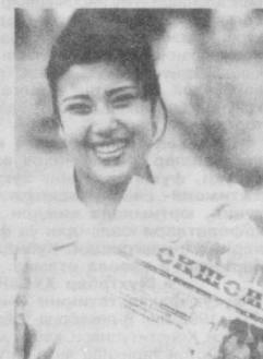
лиф ва мулоҳазаларини билдиришлари, диққатга молик муаммоларни кўтаришлари ва журналистлар билан биргаликда бу муаммоларнинг ечимини топишлари мумкин. (Ўз мухбиримиз)