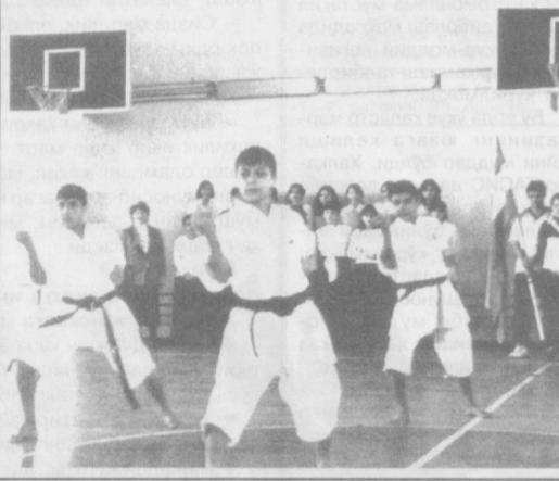
«Умид ниҳоллари»нинг дастлабки босқичлари ўтказилди.