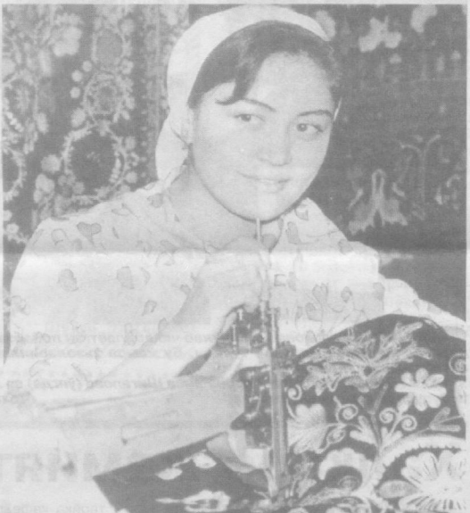
• Меҳнат қилиш...