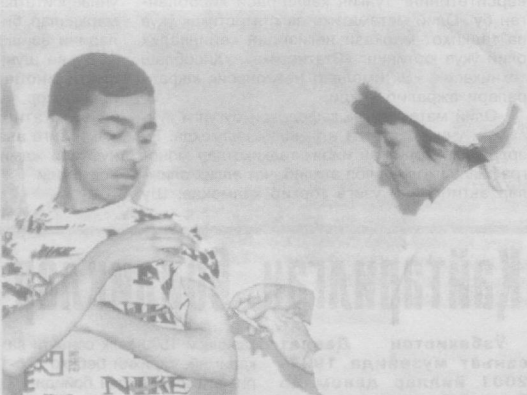
• Малакали тиббий хизматдан фойдаланиш ҳуқуқига эга...