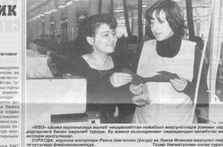
«VISO» қўшма корхонасида ишлаб чиқарилаётган пойабал маҳсулотлари ўзининг харидорлиги билан ажралиб туради. Бу жамоа аъзоларининг сидқидилдан қилаётган меҳнатлари махсулоти.

Анжуман ЮНЕСКО ҳамда Ўзбекистон Республикасининг мазкур халқаро ташкилот ишлари бўйича Миллий комиссияси ҳамкорлигида ўтказилмоқда. Ташкилотнинг мақсади минтақавий тармоқнинг аҳамиятини юксалтириш масалалари кўрилади.