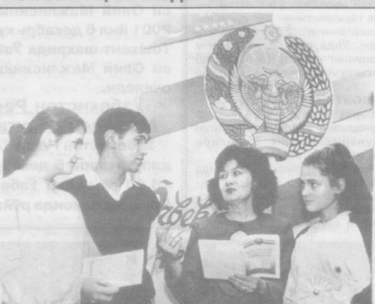
• Ҳар бир шахс билим олиш...