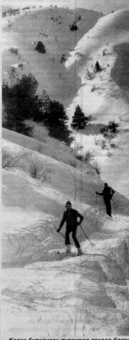
Қорға бурканган пуриқор тоғлар бағрида.

Инсон ирсиятига кўра 120 йил умр «кафолатлаб» қўйилган.