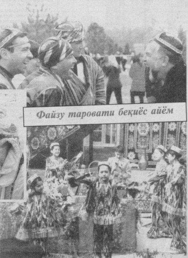
Файзу таровати беқиёс айём

МУШОИРА НАВРЎЗОНА Дил дилга сафар тўтди, Эл элга назар тўтди, Ой йилга саҳар тўтди, Наврўз келди оламга — Кўк ерга хабар тўтди. Ай, менинг кутганларим, Кўзимга суртанларим, Кўрклигим — куртакларим, Новдаларда уйғониб, Оламини тўртганларим. Эрта-инди ёмғирлар Еғар мисли соғинлар, Кетмай бутун овриқлар, Кўкарғайди боғу роғ — Қиш қолдирган чориқлар. Дил дилга тор бўлғайди, Эл элга ёр бўлғайди. Бу — наваҳор бўлғайди, Менинг дафтарларим ҳам Бинафшазор бўлғайди. Гул, райҳон исми диёр, Бугдой нон исми диёр, Ширмой нон исми диёр, Осмонлар эркалаган, Ой, кўёш юзи диёр. Менинг порлоқ кичим, Улуғим ҳам кичим, Айвонингда зийнатим: Онам сувар сепганда Янроқ ёзган бешигим. Нур уйнар танга-танга, На армон жон ва танда. Асал, новот ҳам қанддай Фарзандларинг туғилар — Хар бири бир Ватандай. Сирожиiddин САЙИДИ