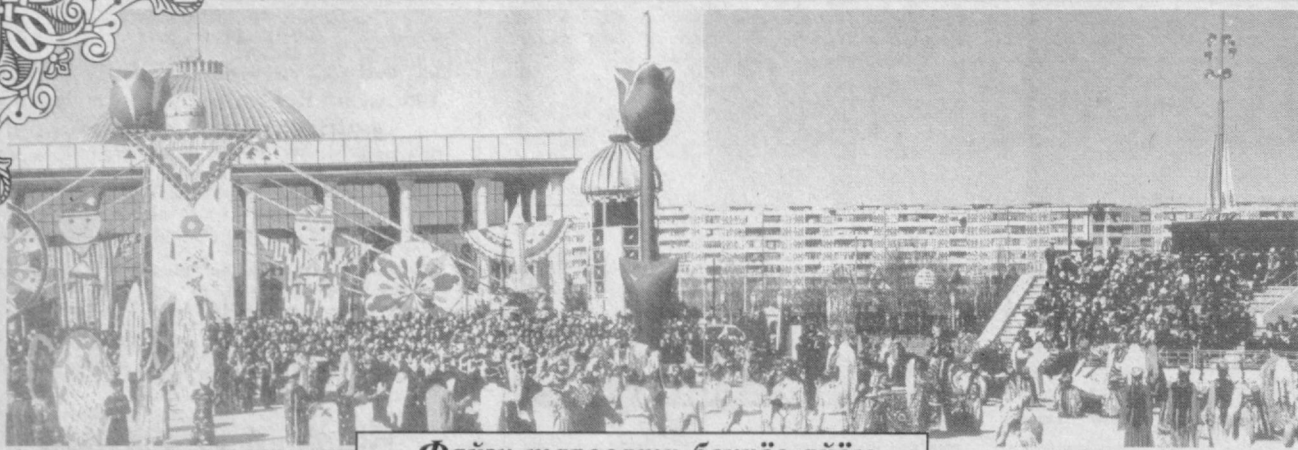
Файзу таровати беқиёс айём

Дунё яшармоқда, гўзал Ўзбекистонимиз йилдан йилга куч-қудратга тўлмоқда — бу бизнинг бахтимиз. Ёш авлод ўсиб, камол топмоқда — бу ҳам бахтимиз, кўпни кўрган кекса авлод яшармоқда — бу ҳам катта бахтимиз. Биз кексалар шундай бахорий ўлкада кўп йиллар яшагимиз келсади, Аллоҳ ўзи химоя этсин, кекса дунё яшарбегини!