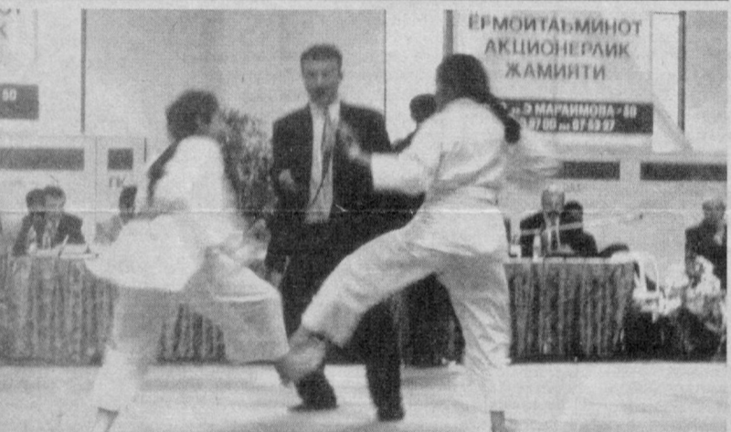
Ғиламда ёш спортчилар.