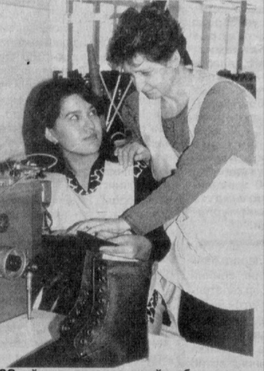
«VISO» кўшма корхонасида кўплаб меҳнатсевар, фаол ёшлар меҳнат қилишади. Уларнинг сая-ҳаракатлари билан махсулот сифати ошиб бормоқда.