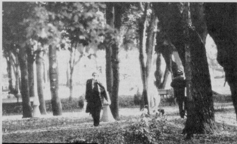
Боғларнинг таровати ўзгача.