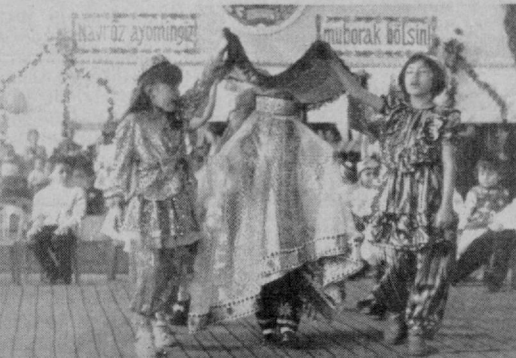
СУРАТЛАРДА: 380-боғчада ўтказилган тадбирдан лавҳалар.