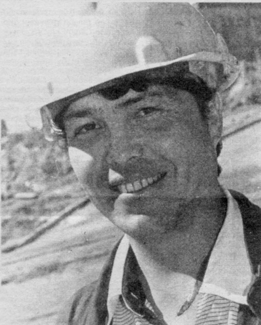
Пойтахтимизда бунёд этилаётган кичик Ҳалқа йўлида бир нечта замонавий кўприклар ҳам қад ростламоқда. Уларни бунёд этишда «7-кўприкқурилиш» трести кўприксоzлари фаол иштирок этишмоқда.

● ШУНИНГДЕК , Шайхонхоўр туманидаги 17-қасб-хунар коллежида, АЛИШЕР Навоий номидаги Давлат кутубхонасида ҳам фахрийлар иштирокида ўтказилган тадбирларда кексаларга мутасаддиларнинг эсдалик совғалари инъом этилди.