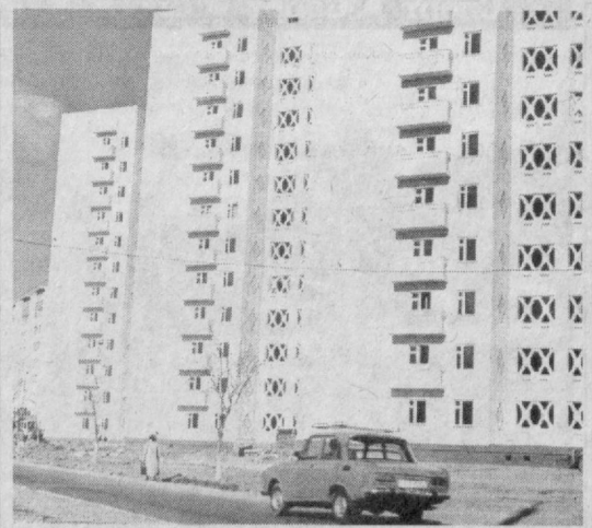
Кўркем замонавий бинолар пойтахтимиз ҳуснига ҳусн қўшмоқда...

Кўнглидаги гаплар... — Ха-я, — дедим шоша-пиша, — ёддан қўтарилибди, ҳеч-қиси йўқ, намагини тўғрилаймиз-қўямиз. — Мана сизга туз, дадаси, — деди кампирим туздонни узата туриб. — Кўлингиз дард кўрмасин, лекин болабасиз, — дейман, кейинини ўйлайман-да. Мулойим вазмин бўлишдек олий фазилатнинг кўнглимга солиниши Яратган эгамнинг марҳамати эмасми. Жаноби пайғамбаримизнинг ўғитларига риоя қилиниб айтилган икки оғиз ширин сўз туфайли иштаҳага иштаҳа қўшилиб, кечки овқат қўйилди ўтди. Бунисига бисёр шукр. Чоли-кампир кўнглим ўргилсин қилиб дамланган кўк чойни майдалаб, телевизор томоша қилдик. Азилар, хонандамиз ўз қўшиғида тилаганидек ҳар кимнинг бир ёр билан ўтиши қандай яхши, бунга нима етсин. Лекин тақдир тақозоси-ла, умидли дунё, иккинчиси билан бўлса-да унинг чехрасидаги нимтабассумни кўриб ўтиш янада яхши. Мулойим вазмин бўлишни унутмайлик, бу ҳислатларга икки оғиз бугўдй сўзимиз қўшилиб борми, гувоҳ бўлганимиздек хонадонда соғлом муҳитнинг барқарор бўлиши турган гап.