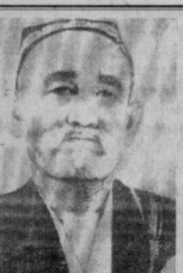
Харфлардан муяссар бўлур хар китоб, Дил харфлар қадрини айлайди офтоб.

Ойбек, Шайхзода, Абдулла Қаҳҳор, Миртемир ака ижодий фаолияти билан чамбарчас боғлиқ лавҳалар яна бир талдай. Шайхзоданинг «Ғазал мулкнинг султони» деган мислсиз мақоласи газета учун махсус ёзилди. Мақсуд Шайхзоданинг азиз дўсти Фафур Фулом вафотида бағишланган ва илк бор газетамизда эълон қилинган чуккур дардли, оташин шеъри қалин дўстликнинг абадий бир ҳужжати бўлиб қолди. Миртемир акамиз-ку, бири-биридан кўркам саҳифалар яратиб, газетанинг ўз қиёсига айланиб қолган эди. Дашту водийлар кенглиги, тилимизнинг оҳори тўқилмаган жилваларини газета саҳифаларига киритиб, жонлантириб юборарди. Баъзан ҳаёлларга толиб ўтираркан, кўллари билан ҳавога аллақандай жумлаларни ёзар, мабодо бирор сўз номақбул тўқола, уни ҳаёлан ўчирадди. Шундай одатлари бор эди. Уйларига бори қолсақ, «болам, бўтам», деб парвона бўлишлари, шеър санъати устида сўз кетганда аввсиз талабчанлиги... бари-бари бир тушдай ўтиб кетди. Абдулла Қаҳҳордай катта адиб ҳам ҳар замон — ҳар замон тахририятимизга келиб турарди. Тошкент зилзиласидан анча ўтган, қандайдир бир иш билан келган эканлар шекилли, хонамизга кириб қолдилар, диванга бир лаҳза ўтириб, бир пиёла чой хўплаб: