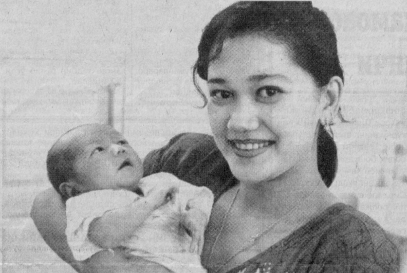
Дунёларга алишмасан сени, болажон!

Генетик шишоркор турт асо-сий масалани ҳал қилади: ку-тилаётган хасталик қайси кўри-нишда бўлади? (ташхис). Кас-саллик қандай ривожланиб бо-риши мумкин? (олдиндан фа-раз). Қандай даволаш мумкин? (даволаш). Ва қандай қилиб унинг олди олинадими? (профи-лактика). Тибиб генетикаси-даги олдиндан фарзлар оддий тибибдагидан бирмунча фарқ қилади. Бунда қандай ходиса рўй бериши мумкин, деган са-вол кўпгина маслаҳат сўраб муурожаат қилган шахсга эмас, балки хали туғилмаган бола-га тааллуқли бўлади. Агар оилда бир бола ирсий нуқсон билан туғилса, бундан кейин-гиларнинг аҳоли қандай бў-лади, деган масала ота-она-ларни ташвишга солади. Буна-