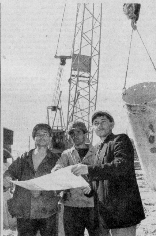
Яккасарой туманида Усмон Носир кўчаси бўйлаб 123 метрик кўприк қурилиши жадал суръатлар билан давом этмоқда. Ушбу қурилишда айниқса 13-кўприк қурилиши корхонаси жамовасининг хизматлари таҳсинга сазовордир.

ларни мукамал яратиш масаласи муҳокама этилди. □ БОБУР номидаги истироҳат боғида дам олувчиларга қулайлик яратиш мақсадида фаолият юритаётган 2 та декоратив сув ҳавзаси, теннис корти, мини-футбол майдони ҳамда спорт-соғломлаштириш маркази келажакимиз ворислари — болажонларга бепул хизмат кўрсатмоқда. □ ШУНИНГДЕК , Хамза туманидаги чикиндиларни зичлаш заводига янги шохобча иш бошлаш арафасида. Бу шохобчанинг ташкил этилиши хориждан келтирилган технологиялар ёрдамида чикиндиларни зичлашда катта қулайлик туғдиради. □ ТОМЧИ қон — хаста учун нахотдир». Республика гематология ва қон қуйиш илмий текшириш институтида маъзур илм маскани қошидаги гемофилия маркази ташаббуси билан ўтказилган хайрия тадбири ана шундай номланди. □ ТОШКЕНТ электротехника ва алоқа институтида талабалар иштирокида уюштирилган «Талабалар баҳори» қўриқ-танловига голибликни телекоммуникация ва информатика техника технологиялари факультети талабалари қўлга киритишди.