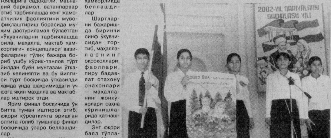
СУРАТДА: танлов қатнашчилари.