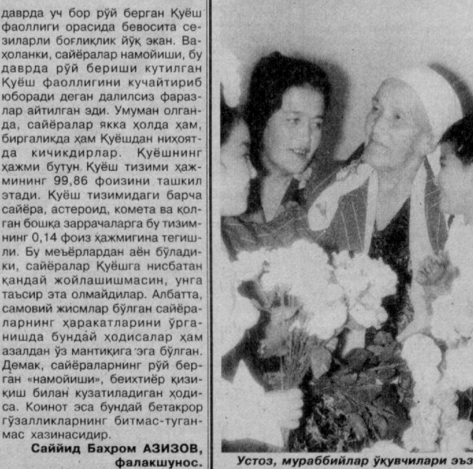
Устоз, мураббийлар ўқувчилари эъзо-зида.