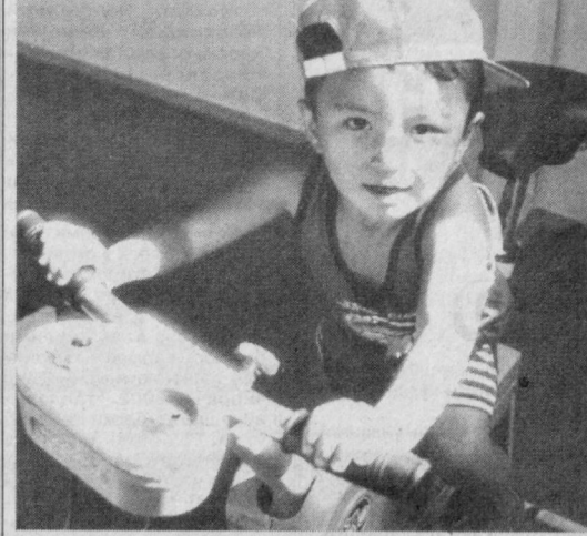
Кичкинтойлар учун фойдали машғулот.