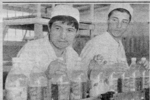
Шаҳримиздаги «Анат» кўшма корхонасида айни кунларда янги ичимлик турларини ишлаб чиқариш ўзлаштирилиб, улар тошкентликларга манзур бўлмоқда.

Давра суҳбатида соҳа бўйича кўтарилган муаммоларнинг ҳуқуқий, ахлоқий ва ижтимоий-маънавий жиҳатлари кўриб чиқилди ва уларнинг ечими юзасидан тегишли тавсия ва амалий тақлифлар қабул қилинди. (ЎЗА).