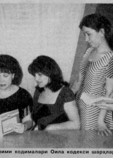
СУРАТДА: Юнусобод туман ФХД ёшлари ходимлари Оила кодекси шарҳлари билан яқиндан танишмоқда.

Оила қуриш фақат икки ёш ўртасидаги иш эмас, балки бу бутун жамият ҳаётига алоқадор масала бўлганлиги боис, ёшлар ўртасида соғлом оила тушуначисини тарғиб этиш,