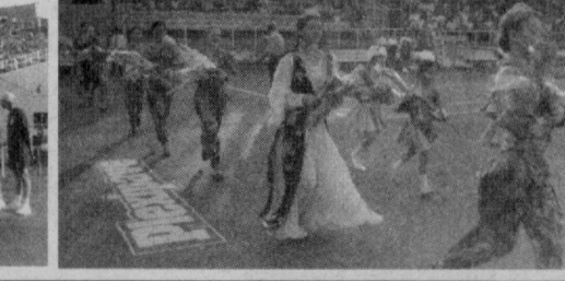
СУРАТЛАРДА: «Тошкент оупен-2002» мусобақаларининг очилиш маросими ва дастлабки беллашувлардан лавҳалар.