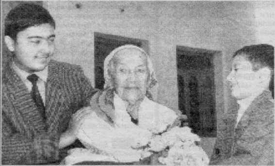
Хонадонимиз фазизи бўлган мунис ва меҳрибон бувижонимиз, доимо соғ бўлинг.