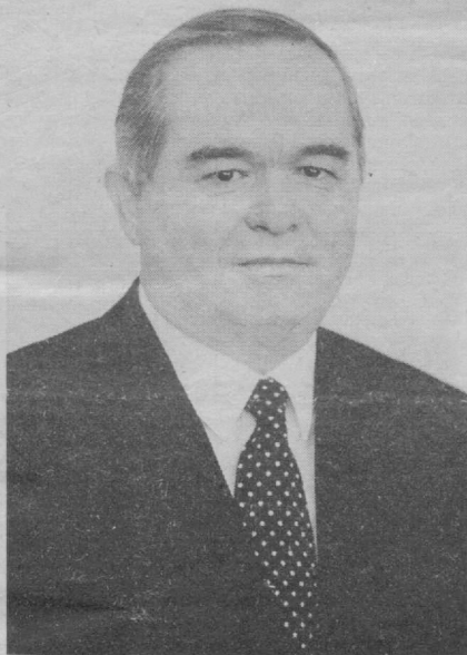
Азиз ватандошларим, юртдошларим!

Барчамиз мана шу лаҳзаларда оила, ёру биродарларимиз даврасида жамулжам бўлиб, байрамона дастурхонлар атрофида тўланиб, ўтиб бораётган эски йил билан хайрлашиб, кириб келаётган янги йилни кутиб олиш учун тайёргарлик тараддудини кўрмоқдамиз.