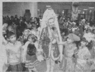
Юртимизнинг барча гўшаларида байрам шодийналари кўтаринки рухда бўлиб ўтмоқда.