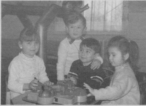
Боғчалар ҳам таълим-тарбия маскани ҳисобланади. Болажонлар бу ерда турли хил қизиқарли ўйинлар ўйнаб, машғулотларда қатнашиб кўнғилли дам оладилар.

Хурматли ҳамшаҳарлар! Ўзингизни қизиқтирган масалалар юзасидан 132-11-39 телефонига кўнғорқ қилсангиз, малакали мутахассислар ёрдамида саволларингизга батафсил жавоб беришга ҳаракат қиламиз.