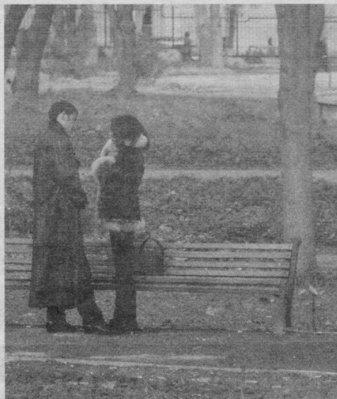
Бокира гулларнинг уфори, у ажиб шўх дамлар эсимда...