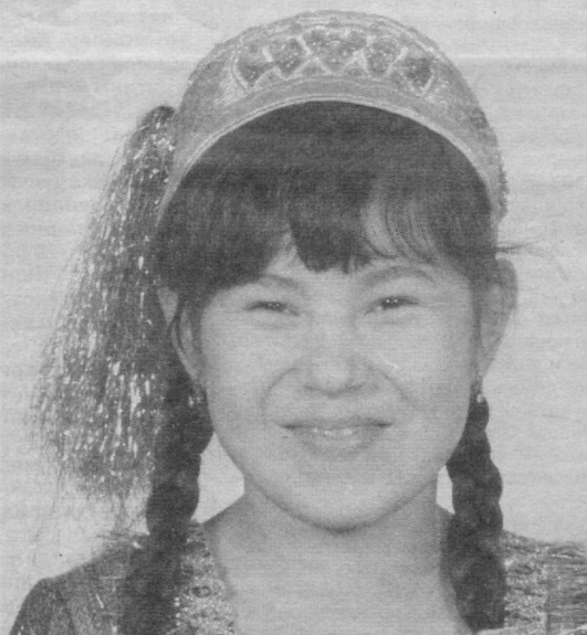
Ёшлик, гўзаллик барқ уриб турган чехрангиздан қулгу аримасин, қизларжон!..