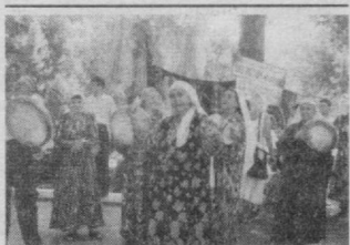
Халқ анъаналари барҳаёт.

— Ҳамма қатори-да... Озиқ-овқат дўконига кирдим. Осмондан тушдим, ердан чиқдим, қаршимда мудир пайдо бўлиб қолди.