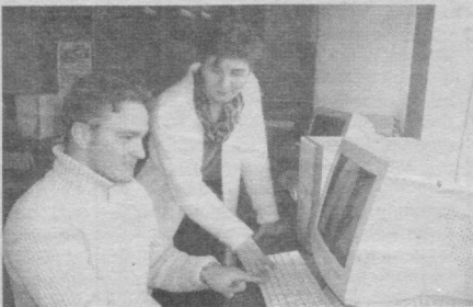
Муस्ताқиллик шарофати-ла она юртимизда кела-жақ ворислари бўлиш ёшларга эътибор кучайиб бормоқда. Хозирги кун ёшлари илмга чанқок, зуққо,

Бунинг сабабларини оилалар даромадлари билан боғлашга ўрин йўқ. Нега деганда жорий ўқув йилидан бошлаб Вазирлар Маъжамасининг қарорига мувофиқ ҳамда Тошкент шаҳар ҳокими фармойиши билан моддий муҳтож оилалар фарзандлари 100 фоиз ҳамма ўқув адабиётлари, шунингдек, ўқув анжомла-