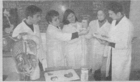
мукаммал ўрганиш йўлида энг замонавий техноло-гияларни эгаллаб, турли тадқиқотлар, изланишлар олиб бормоқдалар.