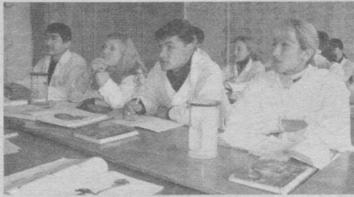
интилувчан ва жуда қизиқувчан йиғит-қизлардир. Фарзандларимиз мамлакатимиздаги олий таълим даргоҳларида илм-фаннинг турли йўналишларини