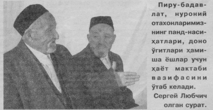
Пиру-бадавлат, нуроний отахонларимизнинг панд-насихатлари, доно ўғитлари ҳамиша ёшлар учун ҳаёт мактаби вазифасини ўтаб келади.