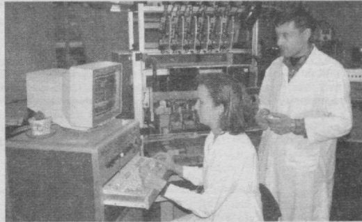
«Фотон» акциядорлик жамияти жамоасининг савий-ҳаракатлари, интилишлари самараси ўлароқ йилдан-йилга маъсулот турлари кўпаймоқда.