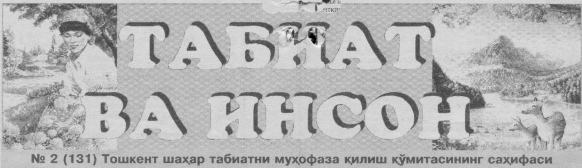
№ 2 (131) Тошкент шаҳар табиатни муҳофаза қилиш кўмитасининг саҳифаси