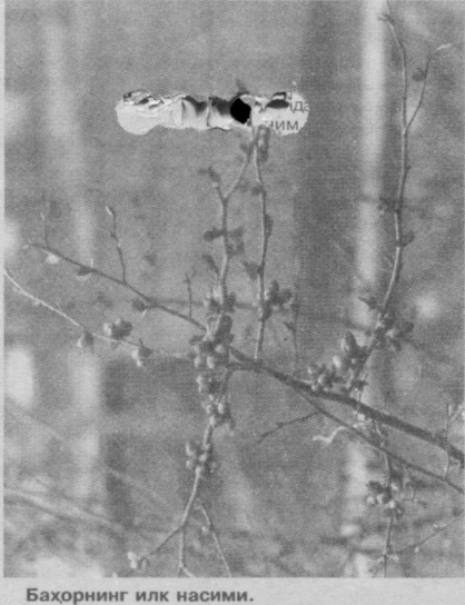
Баҳорнинг илк насими.