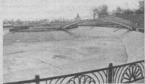
Шаҳримизнинг хушманзара гўшалари.

— Вазирлар Маҳкамасининг 1996 йил 18 январдаги «Ўзбекистон Республикасида одамлар ва ҳайвонларнинг кутуриш касаллигига қарши курашишни кучайтириш чора-тадбирлари тўғрисида»ги 32-сонли қарори билан тасдиқланган «Аҳоли яшаш жойларида ит, мушук ва бошқа ҳайвонларни сақлаш қоидалари» қандай бажарилмоқда?