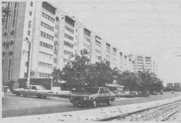
Гўзал пойтахтимиз кўрқига-кўрк қўшаётган кўп қаватли, замонавий турар-жой бинолари, кенг ва раvon кўчалар ҳамшаҳарларимиз ва унинг меҳмонлари кўнглига бир олам қувонч бағишлайди.

Самариддин ХАЛИЛОВ, Тошкент шаҳри ИИББ Матбуот маркази ноҳири.