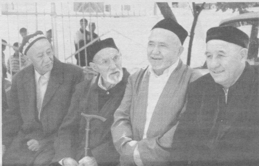
Оилаларимиз ва маҳаллаларимиз кўрки ва файзи бўлган нуруний кексаларимиз бизнинг фахримиз. Улар билан бағримиз бутун, улар билан хонадонларимиз обод.