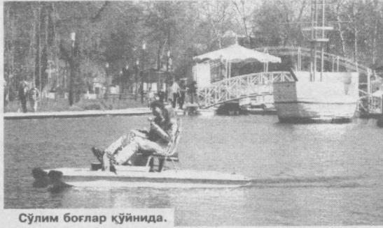
Сўлим боғлар қўйида.