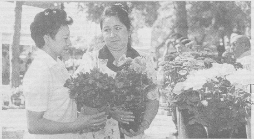
Гулдасталар бир-бирдан гўзал экан.