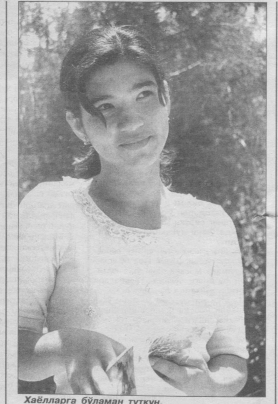
Хайёлларга бўламан тутқун.

Ажабланарлиси, йўлларимиз раван, барча талабларга жавоб бергани ҳолда бошқа бирорта транспорт воситаси мазкур йўналиш бўйлаб қатнамайди. 2519-автокорхона маъмурияти эса баҳоналарни рўқач қилишдан нарига ўтолмайпти. Бизни ўйлантираётган нарса — бундай нохуш ҳол қачонгача давом этаркин? Йўловчиларнинг ўрниди эътирозларига қулоқ тутадиганлар топилавермакми?!