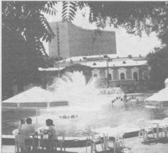
Шаҳримизнинг хушманзара гўшалари.

Инсоннинг сўзлаган сўзи ишлаган ишига мувофиқ бўлиши керак. Донишмандлар: «Тилини тиймаган, ҳар нарсга тилини узатган киши ўз қадр-қимматининг шу нисбатда озаёганини кўради», деганлар. Оз сўз ва сукут эзмалиқдан хайрлидир.