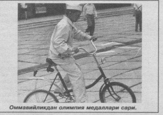
Оммавийликдан олимпия медаллари сари.

Тазквандонинг ИТФ йўналиши бўйича «Алекс» клубининг шаҳримизда фаолият бошлаганига ҳам беш йилдан ошди. Осиё чемпиони, Санкт-Петербургда олимпия медаллари сари.