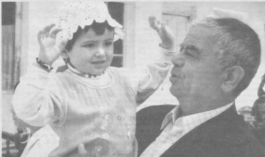
Болалар кулгуси оламни тутсин.