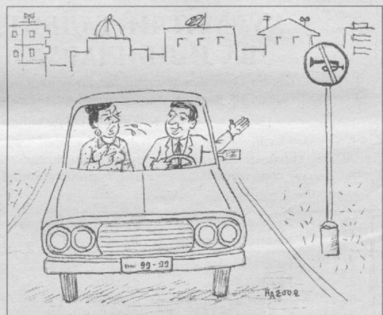
— Бақирмасдан гапир хотин, бу ерда товуш чиқариш мумкин эмас.

Навбатдаги 17-тур баҳслари 10 августда ўтказилади. Анвар ЙЎЛЧИЕВ