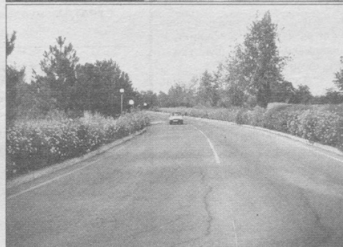
Равон ва текис йўллар манзилгини ойдин қилади.