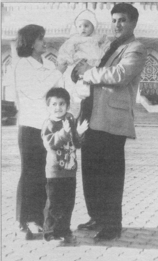
Бахтли ва фаровон оилаларга кўз тегмасин, илоҳим.