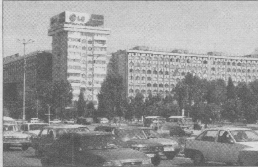
• МУСТАҚИЛЛИК МЕВАЛАРИ

Таърифига тил ожиз бинолар Тошкентимизда жуда кўп. Зеро гап улар ҳақида борар экан, сўз аввалини кутлуг даргоҳ Темурийлар тарихи Давлат музейидан бошлаш жоиз. Бугун бу бино Туронзамин учун абадийлик тимсолига айланган. Шовуллаб турган фавворалар ёнидан ўтиб бино ичкарасига киришингиз билан дастлаб кўзингиз девору шифтрларда ял-ял товланиб турган нақшларга тушади. Уларнинг нақадар сержилолигини кўриб ин-