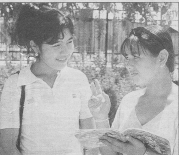
Илму фан сирларини чуқур эгаллаб, келажакка тийрак нигоҳ билан боқаятган гўзал ва лобар қизларимиз эртага буюк момоларимиз Зебуниссою Барчинолар издошлари бўлсалар ажаб эмас.