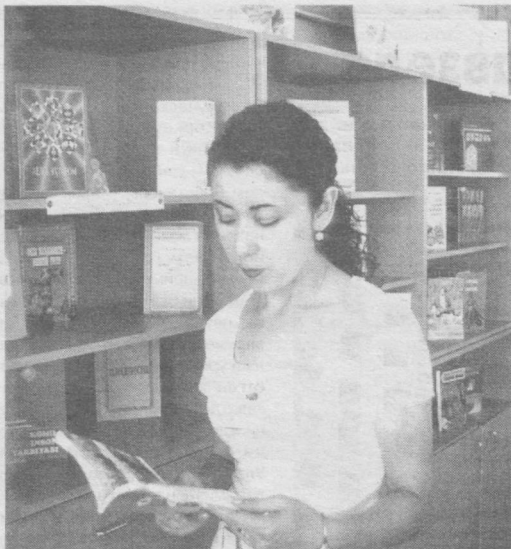
Китоб — билим булоғи, китоб — ақл қайроғи деб бежиз айтилмаган.

Австрияда бу фэйриоддий сайёх келганлигини тасдиқдан пайқашди. Йўл полицияси диққатини пиёда ва велосипедчилар юриши таъқиқланган йўлдан бамайлихотир келаётган кимса тортди. Аввалга уни дайди ёки қочок деб ўйлашди. Кейин эса гап нимаданлигини билишгач, унга йўл қоидасини тушунтиргач, сайёхчи ҳақида журналистлар хабар бердилар.