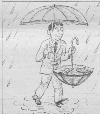
Сўзсиз сурат. Абдурашул ҲАКИМОВ чизган расм.

Қариб қолган онахонга милиционер деди: — Трамвайдан сақраганингиз учун жарима тўлайсиз, холажон. — Ўғлим, мен трамвайдан сақрамадим, ундан тушиб қолдим, холос.