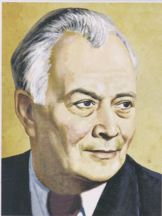
Ўзбекистон халқ ёзувчиси Абдулла ҚАҲҲОР (1907–1968)