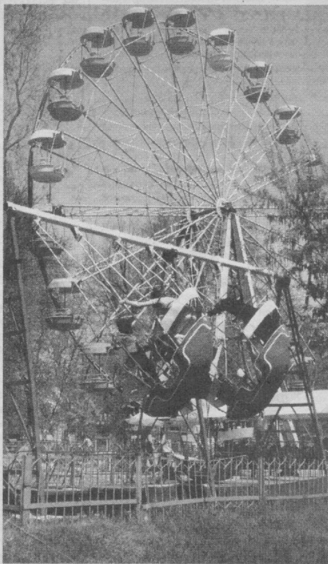
Маданият ва истироҳат боғларимиз ҳамisha ёшларимиз билан гавжум.