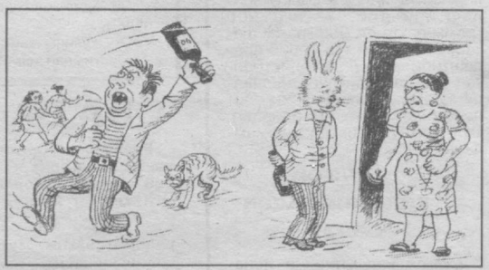
Кўчада ва уйда. Абдурасул Ҳакимов чизган расм.