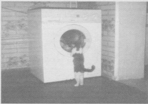
Асли менбоп уйча экан-у сал замонавийроқми, қаердан кирсам экан-а? Эшиги йўқ-ку.

Жиноятчи: Рухсат берсангиз, уни қандай ўлдирганимни сизда кўрсатардим.